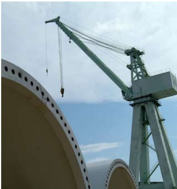
Kilde: Nakskov Havn

Danske Havne fastholder fortsat, at det er en fuldt ud forsvarlig håndtering af sediment at placere det på miljøgodkendte spulefelter. Det bekræftes også af DHI's rapport, der eksempelvis påviser, at udsivningen gennem digerene i Aalborg varer 19.000 år, mens halveringstiden