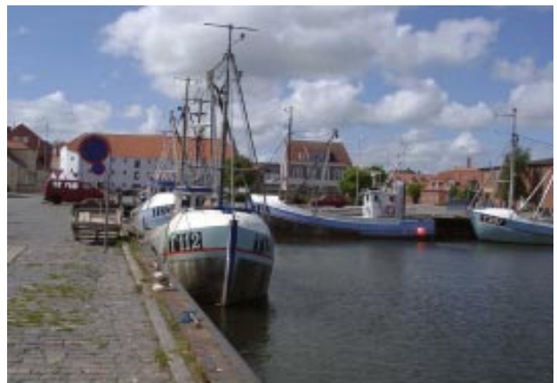
Kilde: Nykøbing Mors Havn

Trafikministeren offentliggjorde på en temadag i TØF-regi den 18. juni 2004 2 nye analyser. Det gælder en ny finansiel analyse og en rapport om de dynamiske og strategiske effekter af forbindelsen. Begge analyser blev grundigt gennemgået af konsulenterne og tegner hver især et meget positivt billede af økonomi og effekt af en broforbindelse. Udover bidraget til forbedret markedsadgang, øget produktion og større konkurrence, vurderes den nye forbindelse at få særlig positiv effekt i regionerne direkte knyttet til forbindelsen.